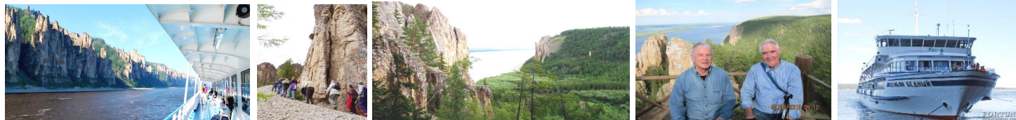
Владение Лены - Республика Саха, Якутия.

Якутск – Ленские столбы – Якутск 36 часов Длительность круиза: 3 дня/ 2 ночи 2026